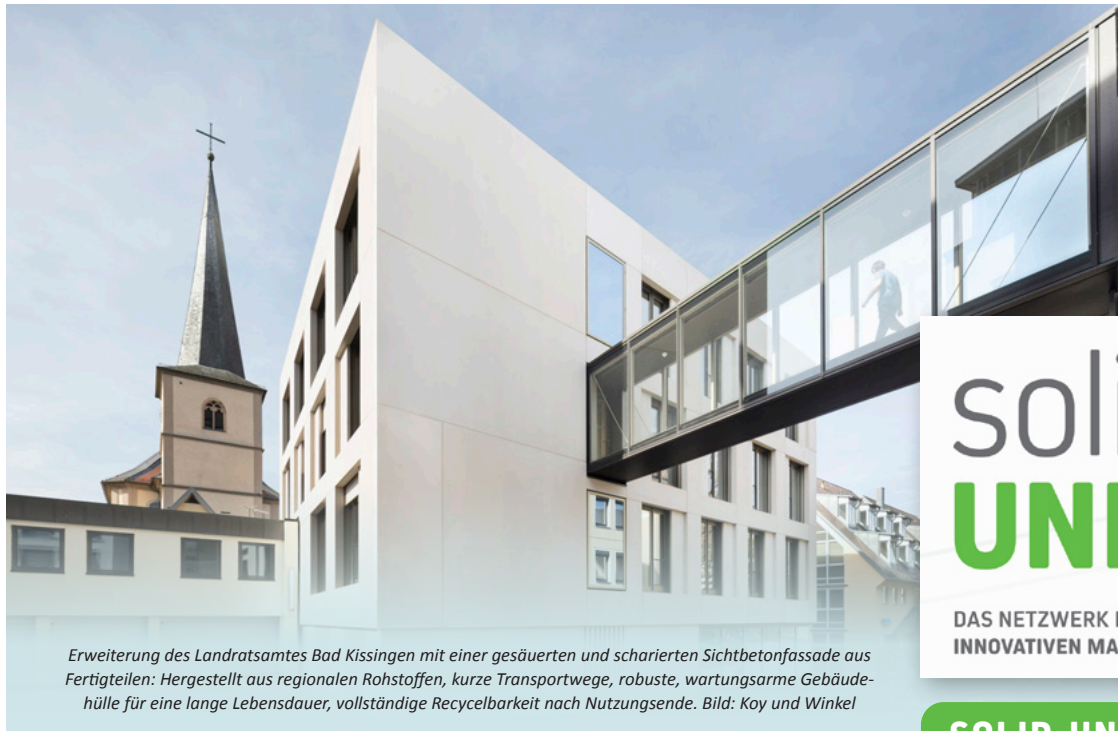
Erweiterung des Landratsamtes Bad Kissingen mit einer gesäuerten und scharierten Sichtbetonfassade aus Fertigteilen: Hergestellt aus regionalen Rohstoffen, kurze Transportwege, robuste, wartungsarme Gebäudehülle für eine lange Lebensdauer, vollständige Recyclbarkeit nach Nutzungsende. Bild: Koy und Winkel